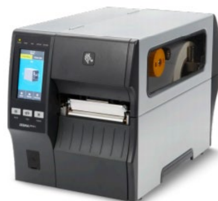
Modello di stampante Zebra ZT411